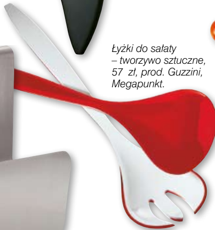
Łyżki do sałaty – tworzywo sztuczne, 57 zł, prod. Guzzini, Megapunkt.