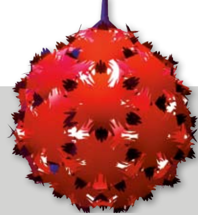
Lampa Estrela – tworzywo sztuczne, średnica 70 cm, 159 zł, Fabryka Form.

Trudno wyobrazić sobie bardziej odważny kolor niż czerwień. Energetyzuje, pobudza i zwraca na siebie uwagę. Jego obecność we wnętrzu zdradza charakter i temperament mieszkańców. Czerwone meble i dodatki w domu sprawiają, że mamy większą chęć do pracy i działania.