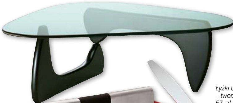
Stolik kawowy – lakierowane drewno i szkło, 93 x 128 x 40 cm, 6739 zł, prod. Vitra, Zoom.