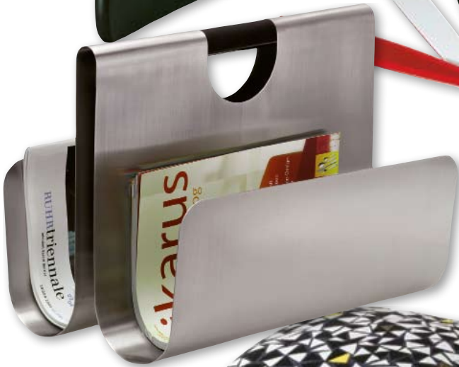
Gazetownik Wactor, – stal nierdzewna, 23 x 40 cm, wysokość 33 cm, 799 zł, prod. Blomus, Fide.pl