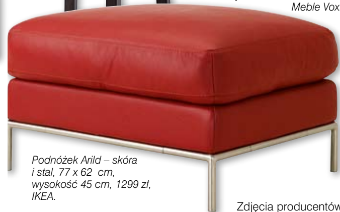
Podnóżek Arild – skóra i stal, 77 x 62 cm, wysokość 45 cm, 1299 zł, IKEA.