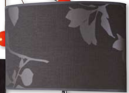
Lampa El Greco – aluminium i tkanina, wysokość 55 cm, 499 zł, Meble Vox.